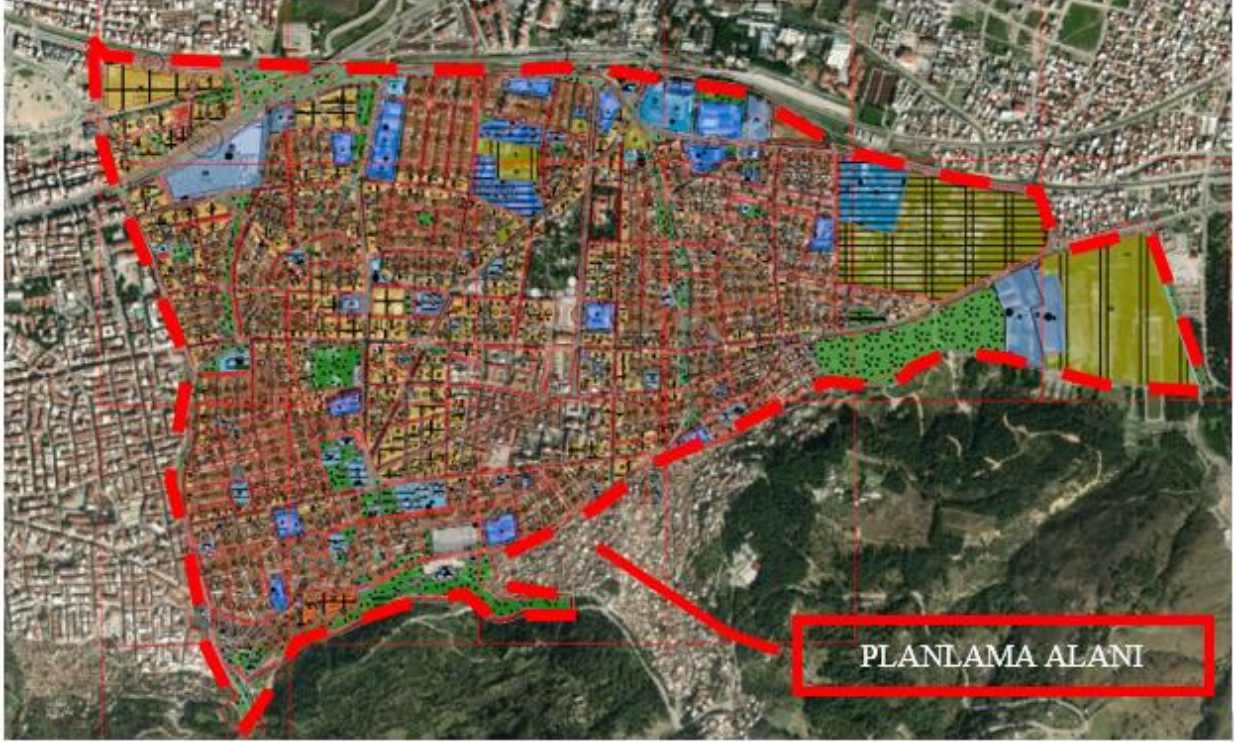
Planlama Alanının Kent İçerisindeki Konumu